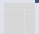
Pagepeel auf Anfrage 230,- TKP