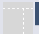
Skyscraper 160 x 600 px 155,- TKP