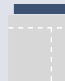
Leaderboard 728 x 90 px 155,- TKP